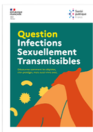
Brochure « Question Infections Sexuellement Transmissibles »