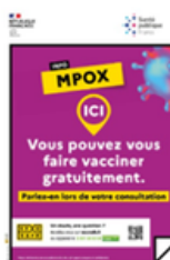
Affiche vaccination pour lieux de soins