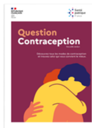
Brochure « Question Contraception »