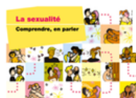
Brochure « La sexualité. Comprendre, en parler »