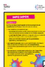
Flyer d'information (transmission, symptômes etc.)