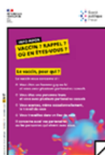
Flyer incitant à se faire vacciner