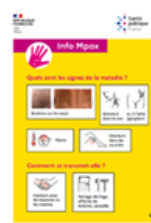
Flyer Falc en français (version anglaise disponible également)